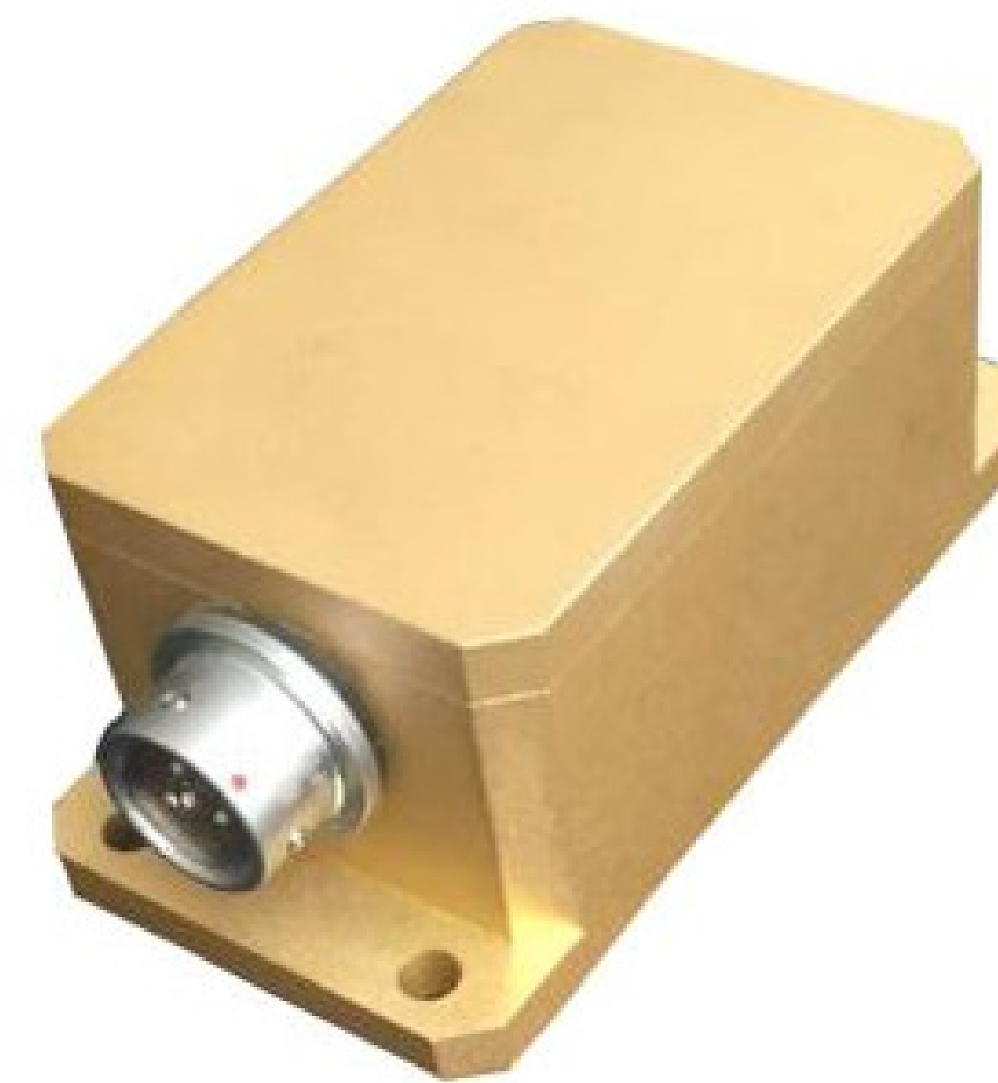
Figure 2: iTS-5实物图